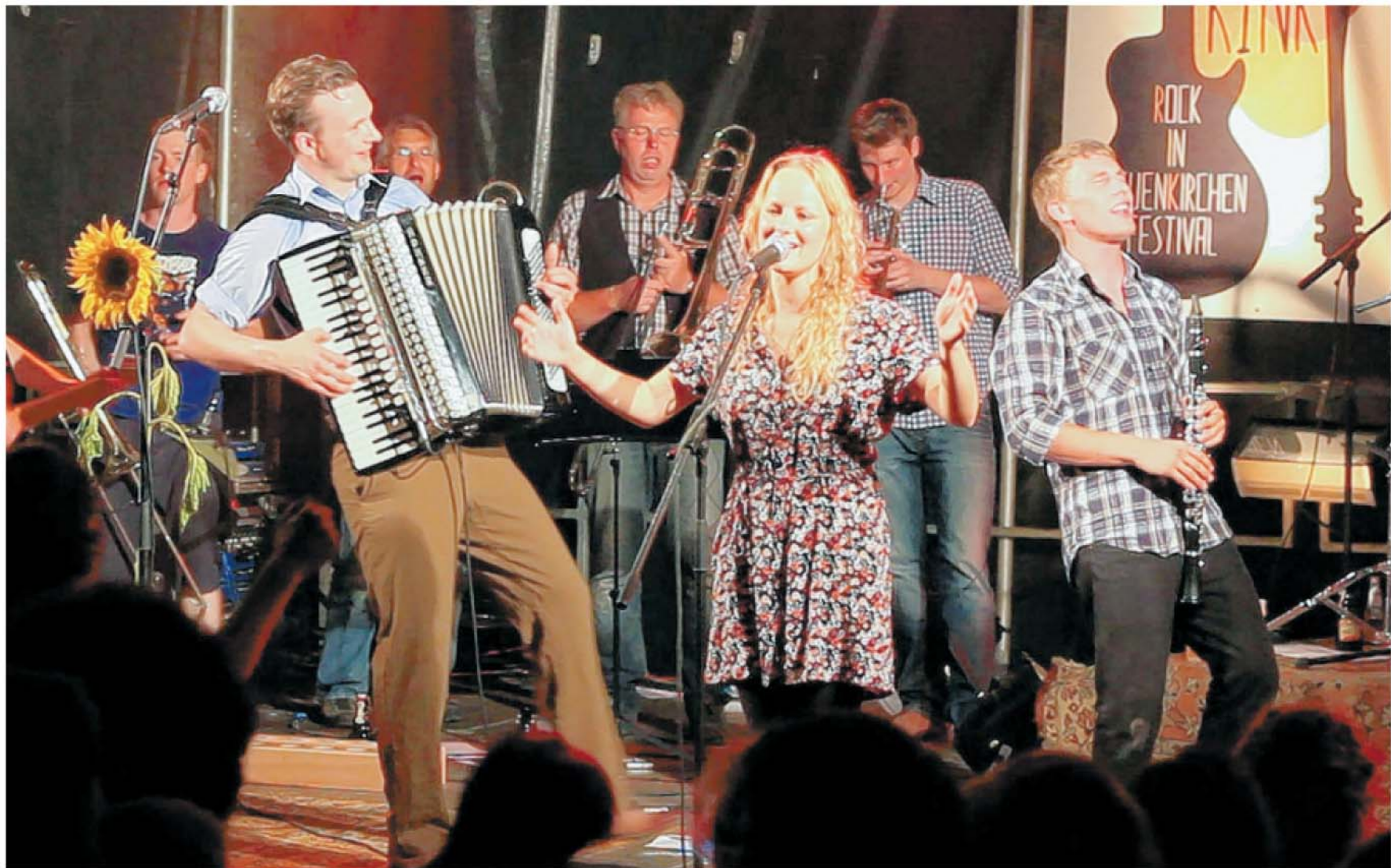
Auf der Bühne: Aus dem „Crystal Pasture“-Konzert beim RINK-Festival in Melle-Neuenkirchen ist jetzt eine DVD entstanden. Drei Kameras hatten den Auftritt im vergangenen August mitgeschnitten.